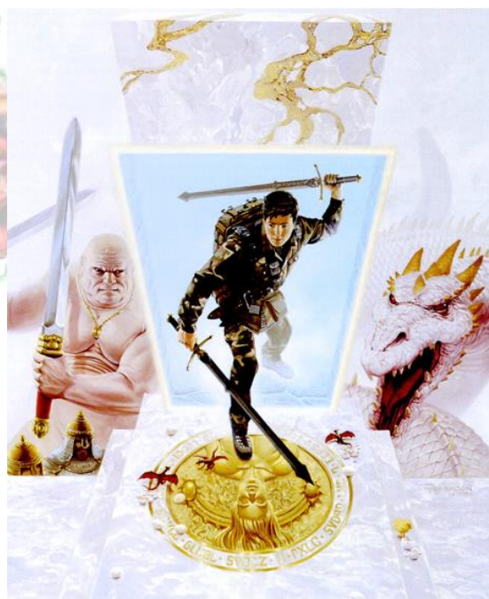
"Door to Another Dimension" af Keith Parkinson