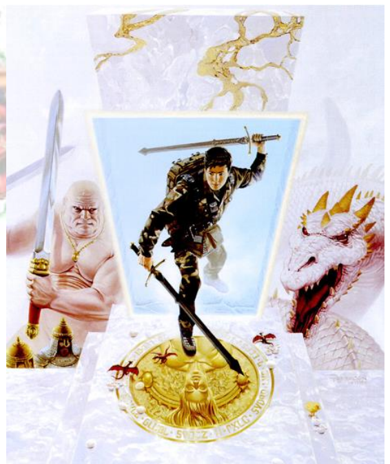
"Door to Another Dimension" af Keith Parkinson