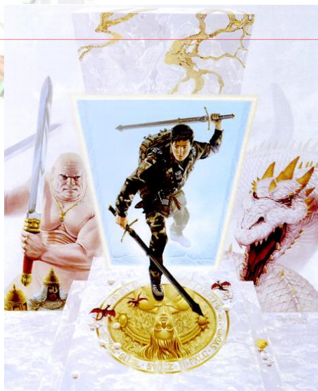
"Door to Another Dimension" af Keith Parkinson